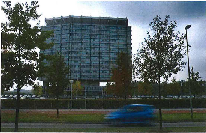
Het kantoor van Philips aan de Boschdijk in Eindhoven op een archieffoto.